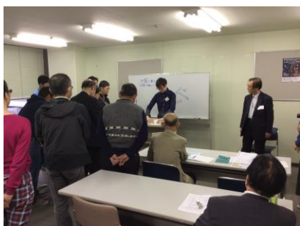
写真 16 Bグループ代表