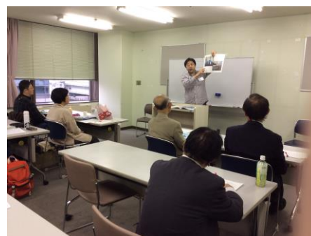
写真 18 A 2グループ代表