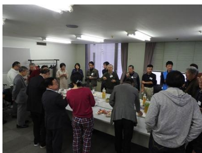
写真 1 4