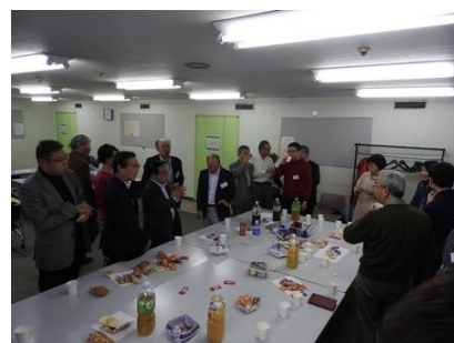
写真 1 5