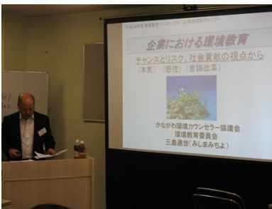
写真9 企業の事例 (三島講師)