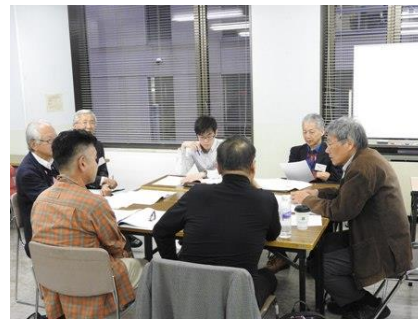
写真 12Bグループ：自然環境