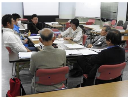
写真 10A 1グループ：地球環境