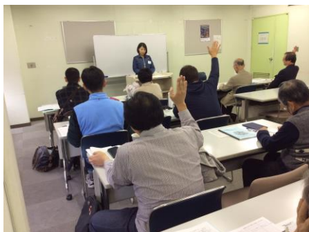
写真 19 A 1 (2)グループ代表