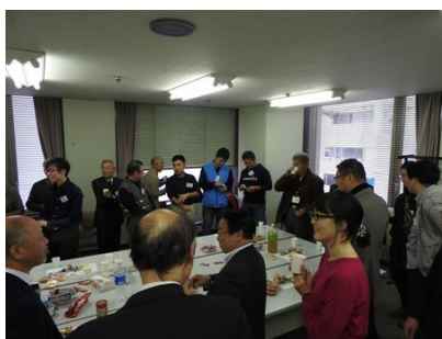
写真 1 3