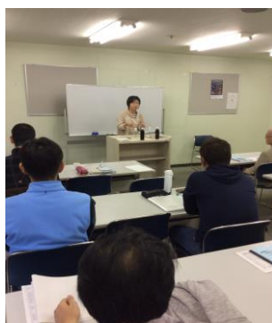
写真 17 A 1 (1)グループ代表