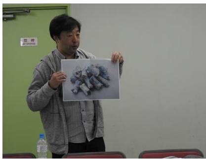
写真 11A2グループ：環境経営